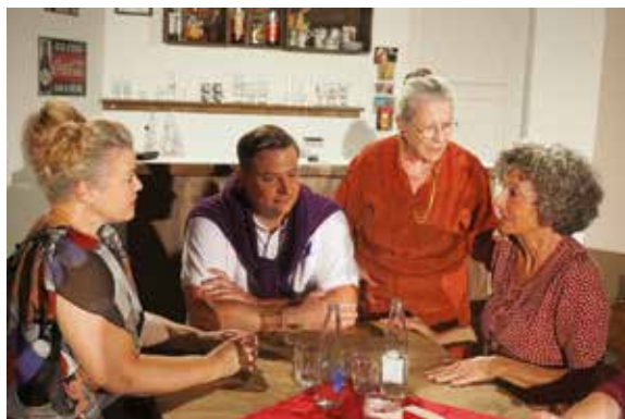
Welchen Rat hat hier wohl das Grosali Lutz?