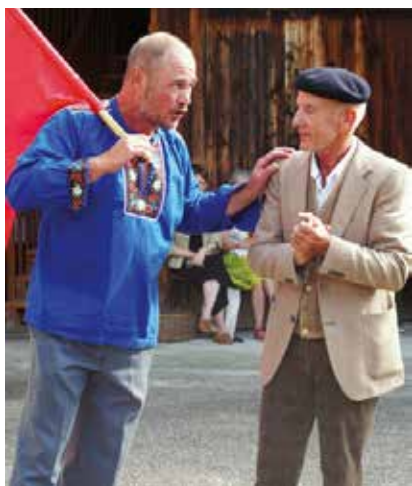
Das Fahenschwingen gehört zu einem richtigen Schwingfest.

Wir fordern Sie heraus, unsere mitreißenden Theaterdarbietungen durch den Blickwinkel unserer Fotos zu erkunden. Unsere Aufnahmen erfassen zahlreiche emotionale Höhepunkte und unvergleichliche Augenblicke auf der Bühne.