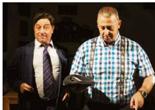
Hier entsteht gerade eine richtig gute Idee.