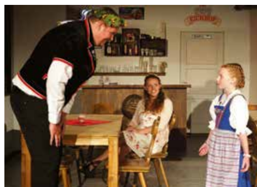
Hier wird gebührend gratuliert.