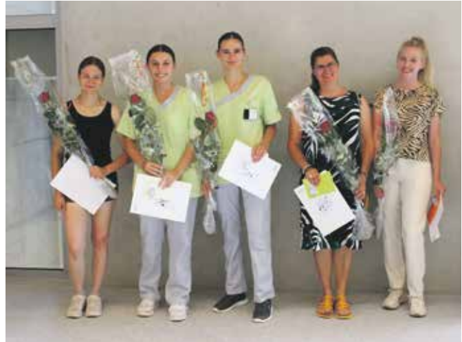
Ariana Shijak fehlt auf dem Bild.

Besonders freut uns, dass Vanessa Morgenthaler und Celina Scheidegger uns weiterhin im stationären Bereich unterstützen werden. Ebenso wird uns Renata Theiler treu bleiben. Sie ist bereits eine langjährige und geschätzte Mitarbeiterin im ambulanten Bereich der Spitex. Wir wünschen allen viel Erfolg und Freude als ausgebildetes Fachpersonal.