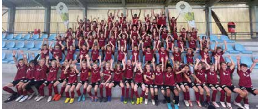
Gruppenfoto Swisscom Football Camp Schötz 2023 mit Kids und Trainerteam

Vom 9. bis 13. Oktober sorgte MS Sports mit dem beliebten Swisscom Football Camp in Schötz für ein Highlight in den Herbstferien. Dank der vorbildlichen Zusammenarbeit mit dem FC Schötz wurden optimale Rahmenbedingungen geboten. Die Kids waren begeistert und gaben Vollgas.