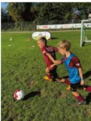
Die Kids gaben vollen Einsatz

Auch abseits des Fussballplatzes fehlte es den Kindern an nichts. Alice Enz vom FC Schötz verwöhnte die 6- bis 15-Jährigen mittags mit einem feinen, frisch gekochten Mittagessen. Die vielseitigen Mittagsprogramme sorgten zudem für Erholung. Ob Panini-Karten tauschen, die Suche nach dem Combinvest Penaltykönig, Lotto oder auch einmal Nintendo Switch spielen, Abwechslung war garantiert. Am letzten Camp-Tag stand die BRACK.CH Mini-WM auf dem Programm, bei der die Kinder in verschiedene Nationalmannschaften eingeteilt wurden. Elia Vögeli (12) aus Altishofen schwärmt: «Den ganzen Tag ‚Mätschle‘ hat mir mega Spass gemacht.» Als Überraschung kamen fünf Spieler und der Trainer der ersten Mannschaft des FC Schötz zu Besuch. Die Freude war riesig und es wurden fleissig Autogramme ergattert. Nach dem Camp wurden die Kinder gebührend verabschiedet: alle erhielten eine Goldmedaille sowie eine Geschenk tasche und einen Ball.