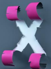
wie «KEINE AHNUNG»