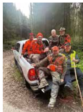
Zufriedene Gesichter bei der Rückfahrt nach erfolgreicher Jagd

Die Gemeinderäte Schötz und Alberswil bedanken sich bei der Jagdgesellschaft Schötz-Alberswil für diesen wunderbare Jagdtag und den wertvollen gemeinsamen Austausch. Der Grundauftrag wird