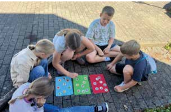
03.09.2025 Spiel ohne Grenzen