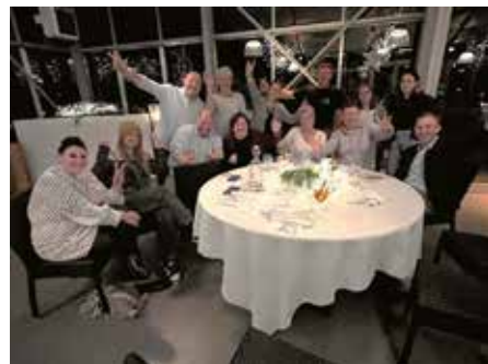
Gewinnerteam vom Spiel „Stadt, Land, Fluss“