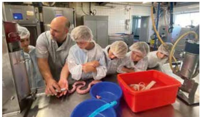
17.09.2025 Wursten & Besichtigung der Metzgerei Willmann