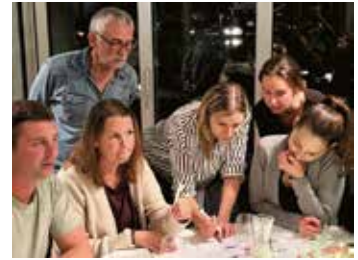
Spannung beim Spiel „Stadt, Land, Fluss“

Am 14. November war es wieder soweit: Unser traditionelles Geschäftsessen fand in der Mangerie statt und war wie immer ein sehr gelungenes Ereignis. Der Abend war geprägt von köstlichem Essen und interessanten Gesprächen. Besonders schön war es, sich auch mit Personen auszutauschen, mit denen der Kontakt eher selten ist. Ein weiteres Highlight war das spannende Spiel "Stadt, Land, Fluss", welches in Gruppen gespielt wurde. Es sorgte für viele Lacher, besonders wenn die ein oder andere ungewöhnliche Antwort auf den Tisch kam. Ebenso lockerte das gemeinsame Lottospiel die Stimmung auf und sorgte für eine extra Portion Spannung.