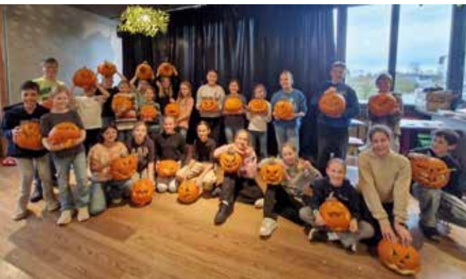
29.10.2025 Kürbis schnitzen