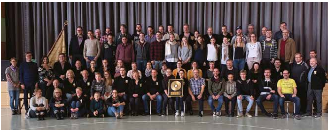
Besuch der BBS im Jahr 2019 in Winterlingen anlässlich ihres 100-jährigen Jubiläumskonzertes

Auch nach der Gründung der Brass Band Schötz im Jahr 2006 konnte die Freundschaft aufrechterhalten werden. Ein Grund hierfür war sicherlich, dass auch auf privater Ebene schon langjährige Freundschaften entstanden sind, die bis heute immer noch gut gepflegt werden.