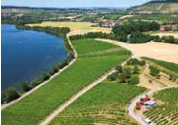
Weinsbergtal mit Breitenauersee