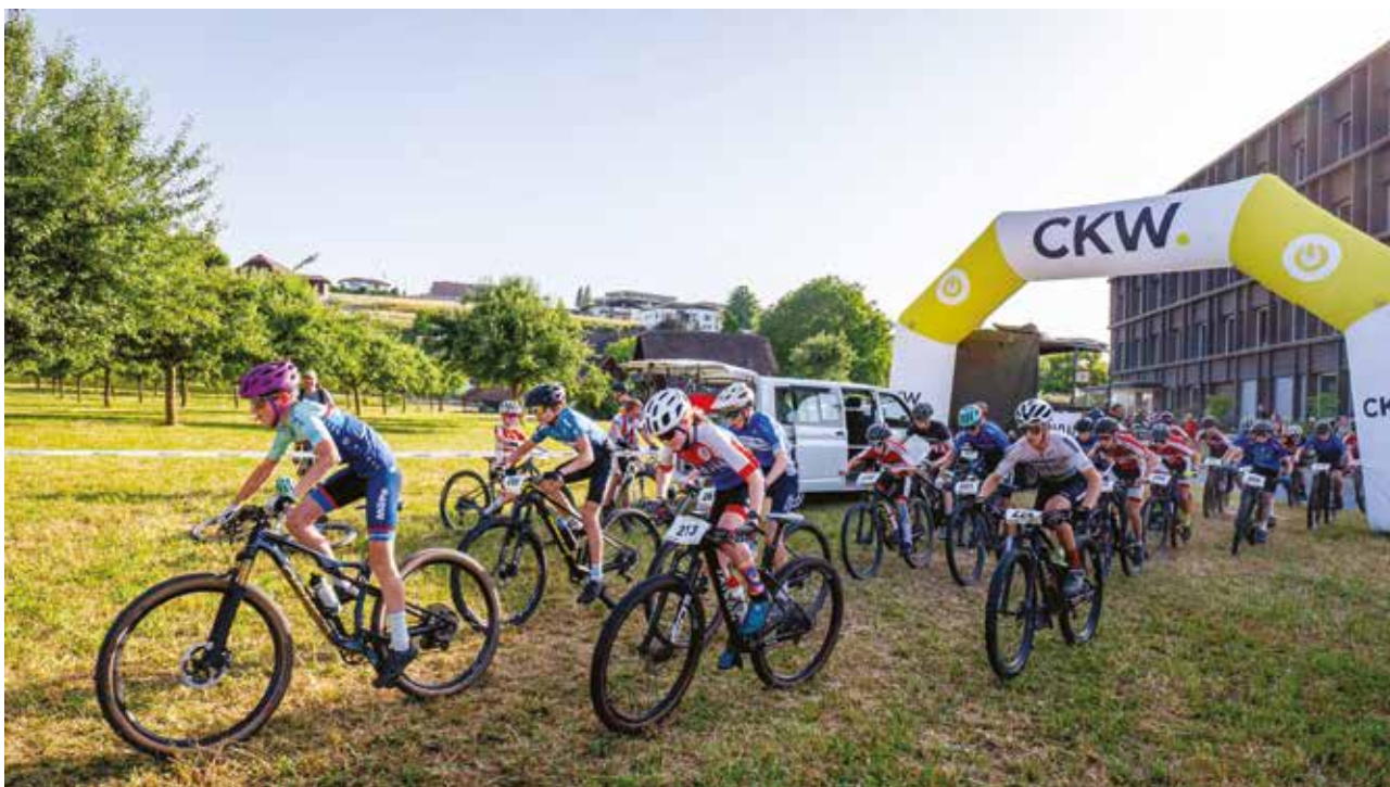
Startschuss letztes Jahr in Schötz

Auch im Jahr 2026 finden die traditionellen Mittwochabendrennen im Rahmen des Luzerner CKW-Cups statt. Die Rennserie bietet Kindern, Jugendlichen und Erwachsenen aus der ganzen Region die Möglichkeit, sich auf dem Mountainbike sportlich zu messen. Dabei stehen der Spass am Velosport sowie die Förderung des Nachwuchses im Zentrum. Nach den bereits ausgetragenen Strassenrennen folgen im Juni wiederum die beliebten Mountainbike-Rennen.